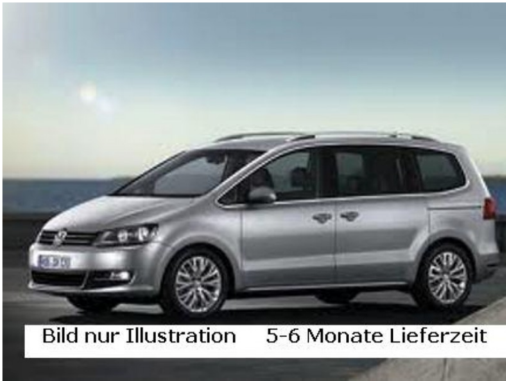
Bild nur Illustration 5-6 Monate Lieferzeit

ANGEBOT FÜR FAHRZEUG: VW - Sharan 2.0 TDI BMT Trendline 170PS DSG6